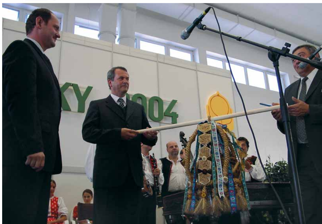
Odvzdávanie dožinkového venca zástupcami Slovenskej poľnohospodárskej a potravinárskej komory SR a Družstevnej únie SR ministromi pôdohospodárstva Slovenskej republiky – výstava Agrokomplex a COOPEXPO 2004.