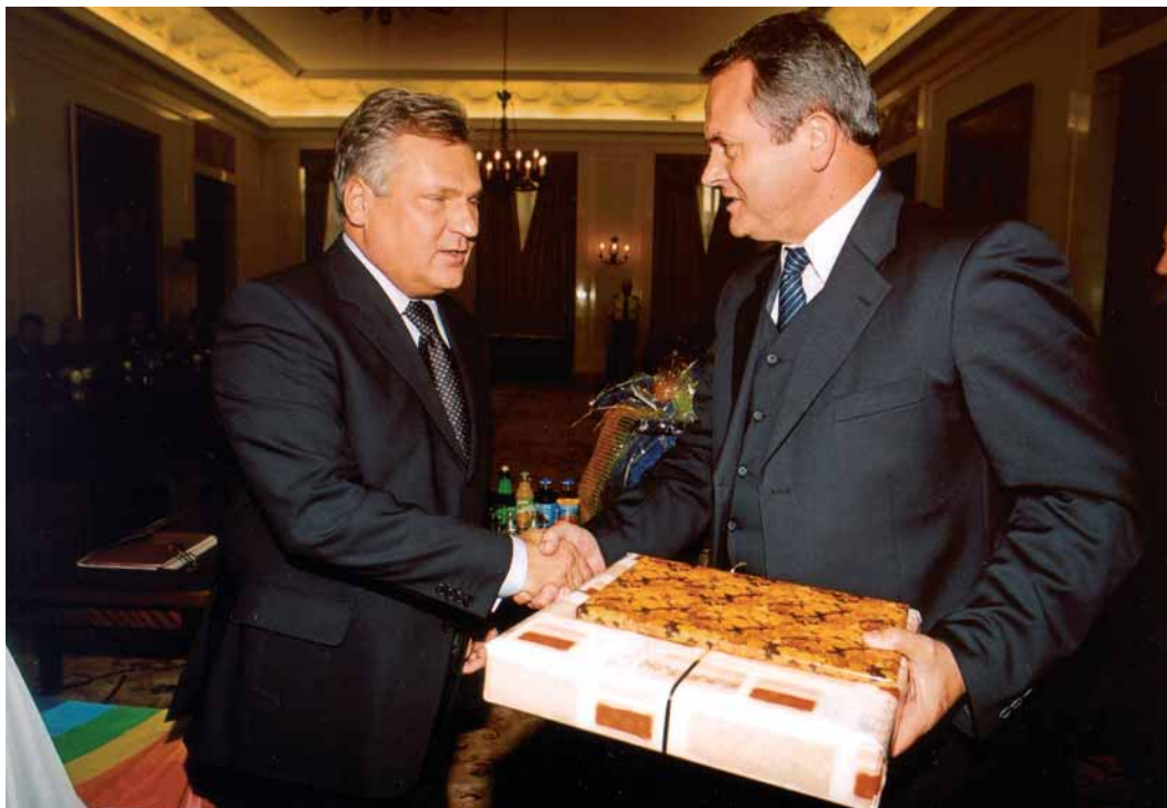
Stretnutie prezidenta Poľskej republiky Aleksandra Kwasniewskeho s predsedom Predstavenstva Družstevnej únie SR pri príležitosti prijatia členov Európskej rady MDZ vo Varšave v septembri 2004.