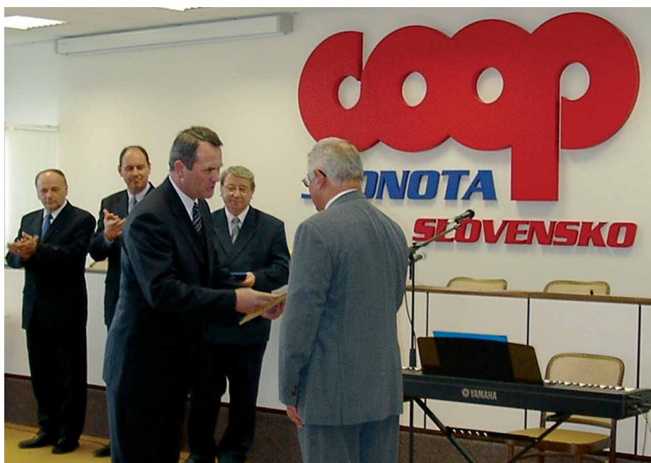
Odvzdávanie Družstevnej ceny Samuela Jurkoviča vyznamenaným družstevným kolektívom a jednotlivcom dňa 30.6.2004.